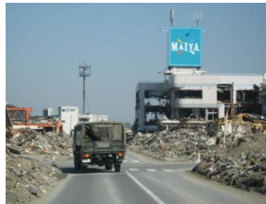
震災後間もない陸前高田市内