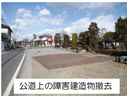
公道上の障害建造物撤去