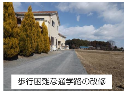
歩行困難な通学路の改修