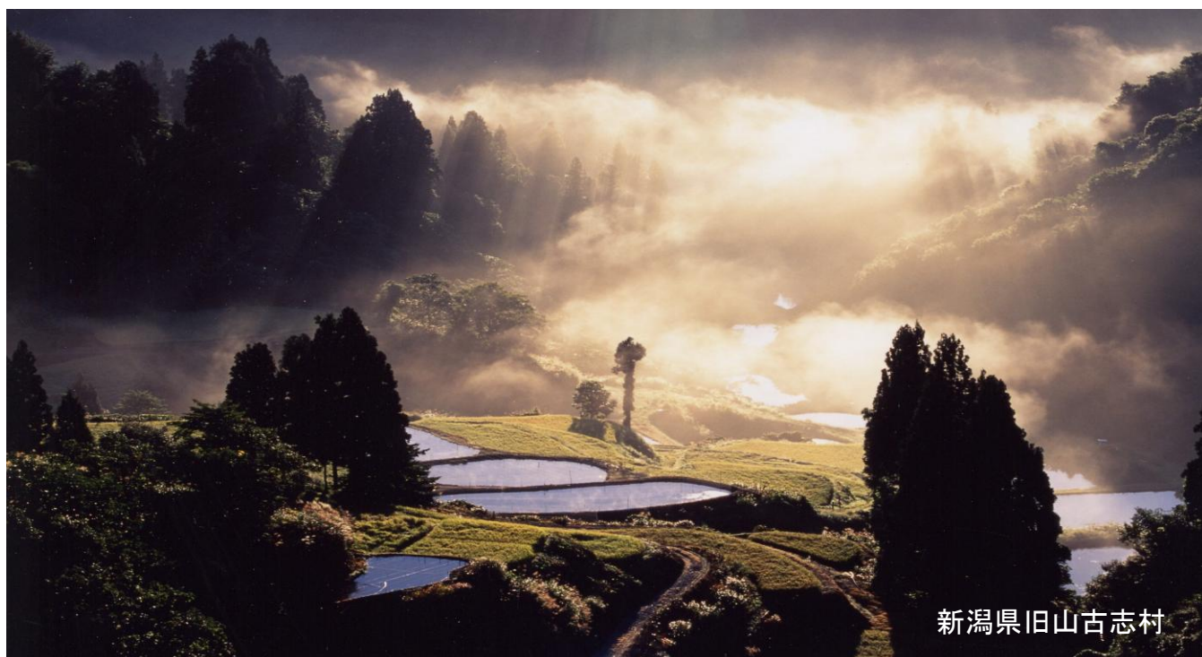
新潟県旧山古志村